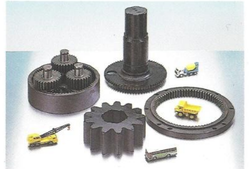
◆ 建設機械減速齒輪總成