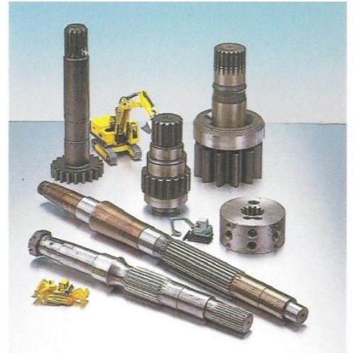
◆ 建設機械齒輪及泵浦齒軸